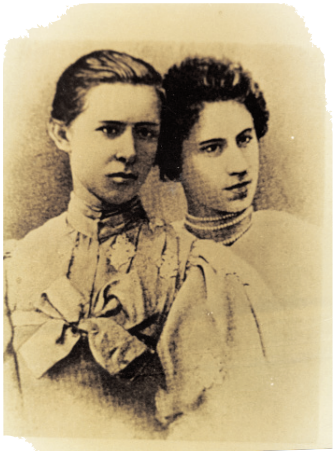
Леся Українка з Ариадною Драгомановою, дочкою М. П. Драгоманова

НАДЗВИЧАЙНО цікавою є ідейно-творча співдія вченого і молодого драгомановського покоління українського письменництва, зокрібно Лариси Косач (Лесі Українки). В її становленні, як ідейному, так і літературному, вельми значною була роль листів дядька та безпосереднього спілкування з ним у Болгарії. Їх епістолярій засвідчив важливу роль Драгоманова у здійсненні планів молодого літературного громади у Києві щодо поширення європеїзму через переклади "плеядів" кращих творів західних авторів – Свіфта, Гайне, Гюго й багатьох ін. М. Драгоманов дораджував Лесі, що саме їй варто перекласти, і за це вона була вдячна (лист від 5 січня 1890 р.), інформував її про наукові видання, болгарську літературу, надсилав різноманітну лектуру. Дослухаючися до його порад, вона "спасалася" від українсько-російського "невежества", вивчала італійську мову.