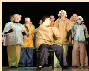
Театр-студія "Міст" (художній керівник і режисер Віталій Любота)